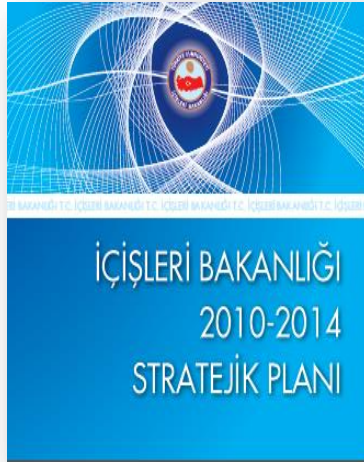
1. SP (2010-2014)

Madde 9- Kamu idareleri; ...katılımcı yöntemlerle stratejik plan hazırlarlar.»