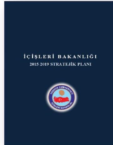
2. SP (2015-2019)